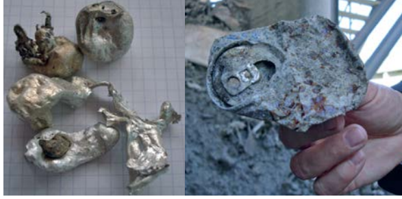
Dip küllerinden kazanılan erimiş alüminyum ve alüminyum içecek kutusu

Genellikle özel bir geri dönüşüm programı ile toplanamayan ambalaj çöpleri diğer ev çöplerinin içine karışmaktadır ve bunlar yüksek oranda alüminyum ve diğer metalleri içermektedir. Çöplerin topluca yakılmasından sonra fırında oluşan dip külünde de bundan dolayı demirden sonra en fazla bulunan metal öge alüminyumdur. Günümüzde bir çok WtE tesisi (atıktan enerji elde edilen tesis) dip külünden 0.5 ile 3.0% arasında değişen oranlarda demir-dışı metalleri ayrıştırılmaktadır. Geri kazanılan alüminyumun maddi değeri ayrıştırma ekipmanlarına yapılan başlangıç yatırımı bir yıldan daha kısa bir süre içinde maliyetini geri ödeyebilmektedir.