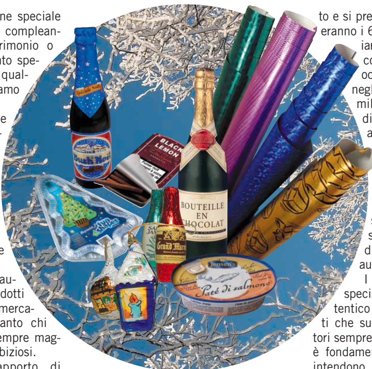
All'interno questo e altro sui prodotti di lusso in foglio di alluminio

Secondo le previsioni entro il 2009 le vendite di alimenti e bevande raggiungeranno i 120 miliardi di dollari (106,4 miliardi di euro). Anche le vendite di particolari prodotti di bellezza sono in aumen-