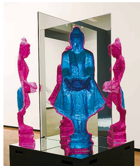
Buddha of Infinite Directions

Il foglio è stato scelto quasi per caso da Warner Lachlan per il suo già premiato Buddha di Infinite Direzioni quando un giorno si imbatté in un'impronta lasciata su un alluminio per uso domestico dopo che era stato utilizzato per coprire un tegame. Warner ha scelto come mezzo espressivo l'alluminio prodotto da Carcano perché colpito dal suo aspetto apparentemente effimero, delicato ed evanescente e anche perché crede che contenga dei riferimenti interculturali, tra cui la cristianità e la commercializzazione della tradizione pasquale. "Comunque quel che più conta per me è che esprime molti aspetti degli insegnamenti buddisti".