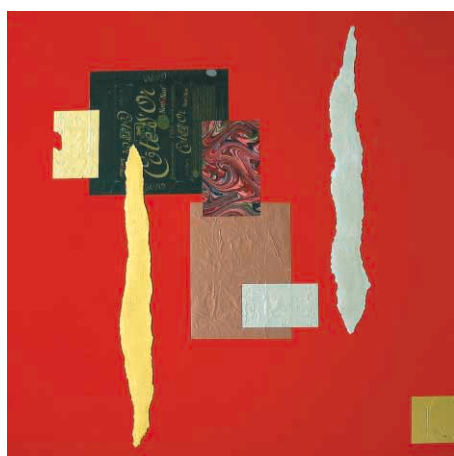
Chocolate Obsession Collage

L'artista canadese Christina Stahr, per esempio, ha usato il foglio di alluminio per creare il suo Chocolate Obsession Collage , che rappresenta la sua passione per il cioccolato ed è fatto con incarti di cioccolatini che lei stessa ha mangiato, con l'aggiunta di sottili lamine d'oro o d'argento e alluminio colorato che rievocano gli incarti in foglio riflettente. Il foglio è avvolto intorno alla tela senza cornice per dar vita ad un'opera che imiti l'imballaggio originale. Quest'opera di Christina è stata esposta al Museo del Cioccolato di Colonia, al Museo di Arte Moderna di New York e in molte altre città del mondo.